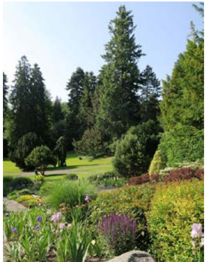
> Photo : le jardin botanique

Conférence et retours d'expérience puis visite des jardins de Folie' Flore.