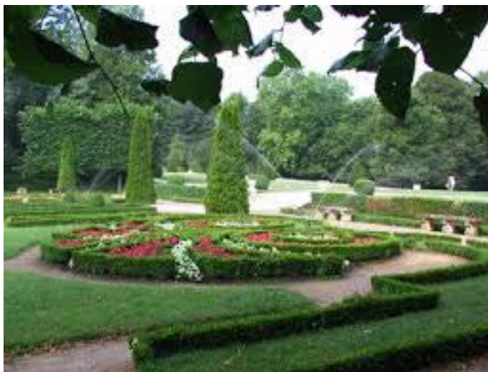
Le parc Wallach, la bellisé Jardin remarquable